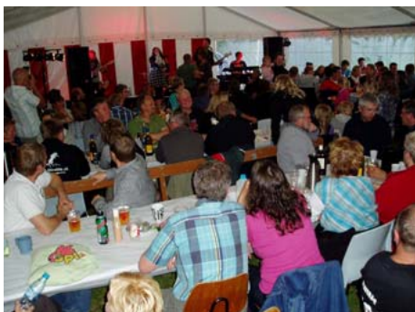
Stemmingsbillede fra familieaftenen