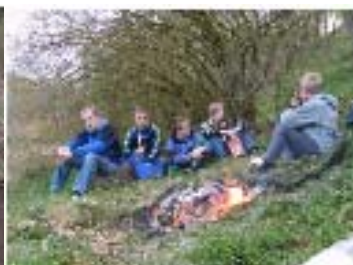
Billeder fra den sidste aften før sommerferien. Det flyvende tæppe og bålhygge.