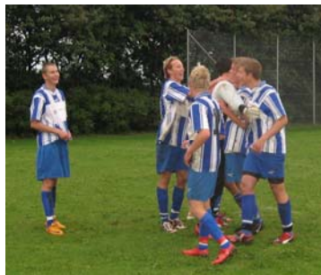
Fantastisk sportssæson for Nørskovlund IF, læs mere side 9