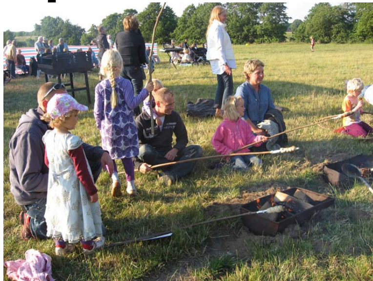
Midsommerstemning til årets Sct. Hans bål, læs mere side 4.

FOR HINGE SOGN www.hinge-noerskovlund.dk