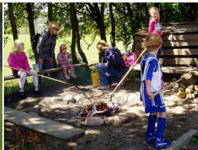
Åbent hus i idrætsinstitutionen ved Egns- og Sportsfesten

Redaktion: Jens Dybbro, mail jens@dybbro.net Tryk: Accord-Tryk, Sidste frist for indlevering af materiale til næste Aktivitetsblad er d. 1/12-09