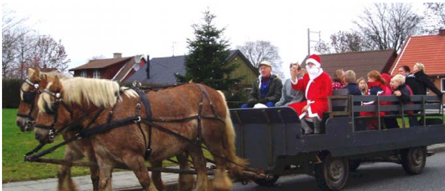
Billede fra et af julemandens tidligere besøg!

Arr. Beboerforeningen og Støtteforeningen for Nørskovlund Forsamlingshus