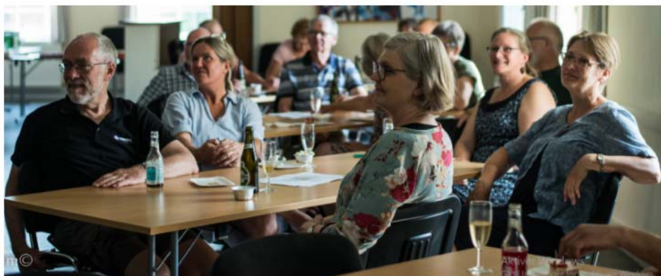
Billede fra premieren på vores Landsbyfilm