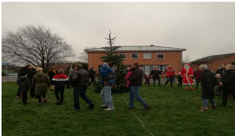
Arr. Beboerforeningen for Hinge Sogn og Støtteforeningen for Nørskovlund Forsamlingshus