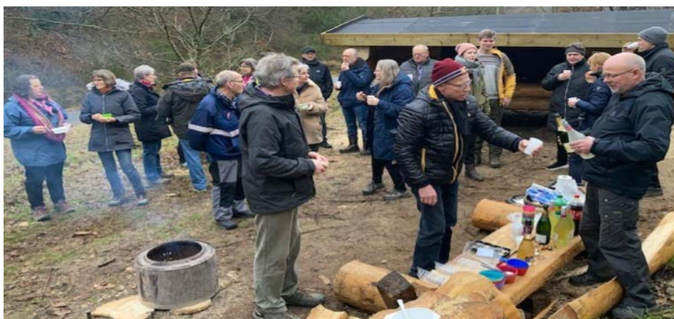
Billedet er fra Lokalrådets Nytårskur/tur, som gik til shelterpladsen på Banestien. Her blev der serveret varm suppe, champagne og kransekage.